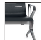
Piede-bracciolo alluminio lucido Polished aluminium leg-arm