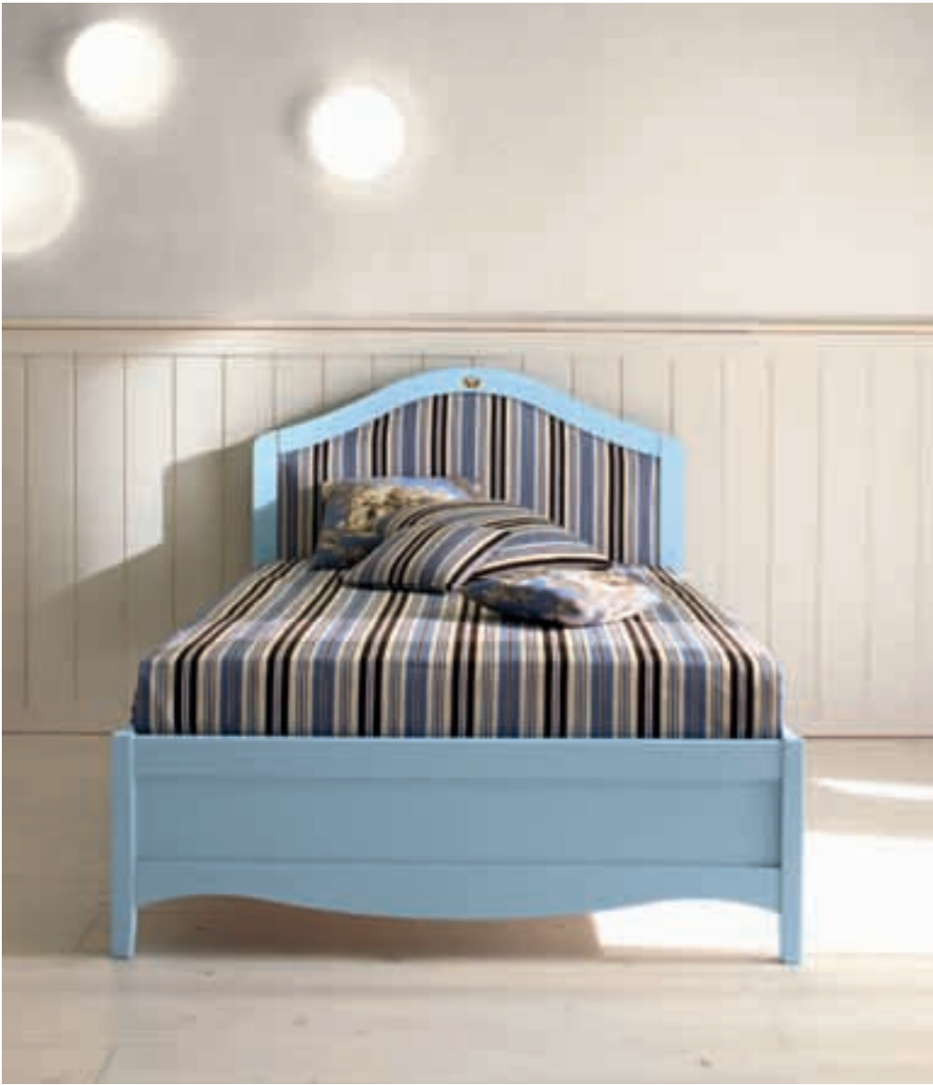
Letto 000 Letto 000