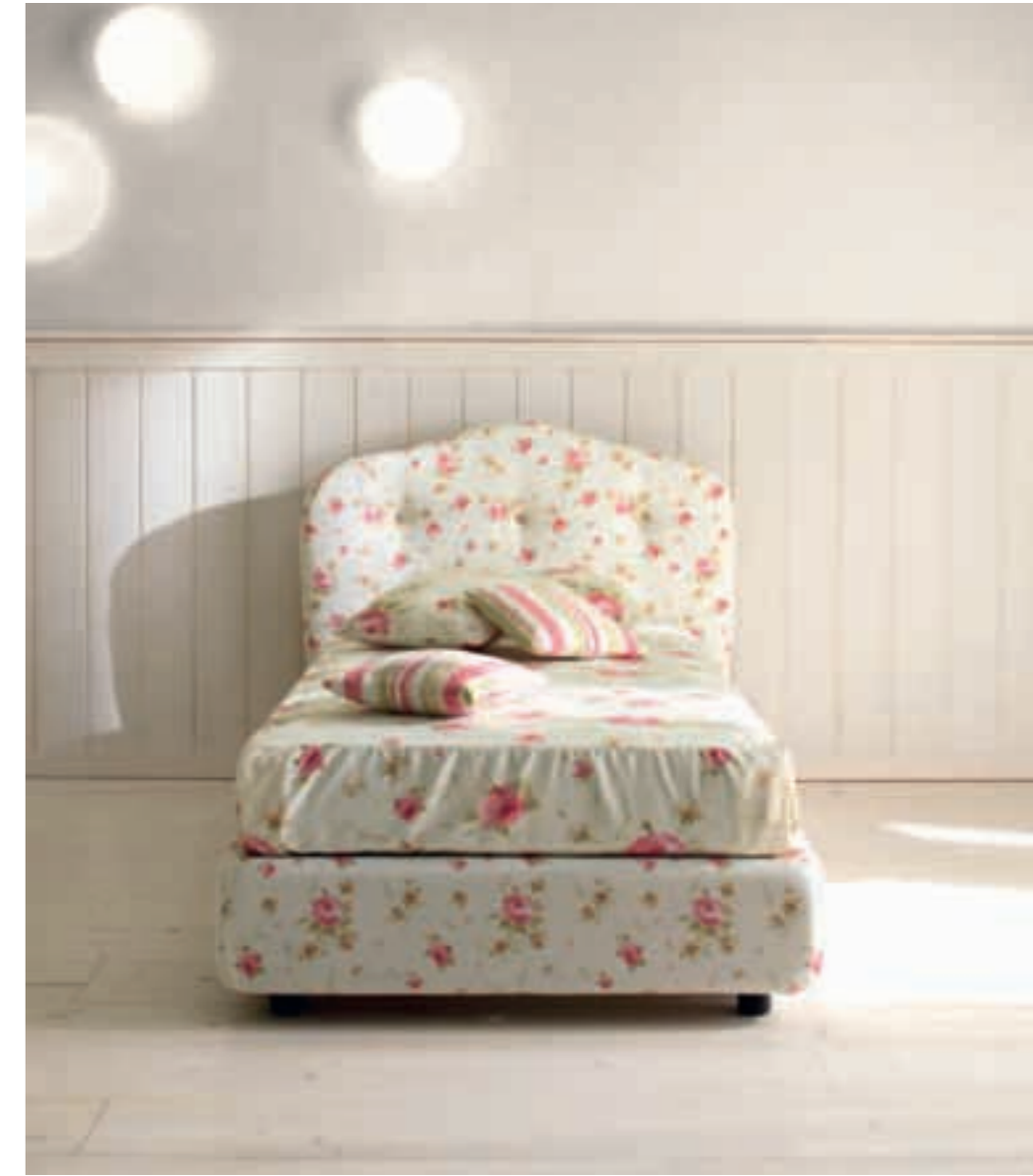
Letto 000 Letto 000