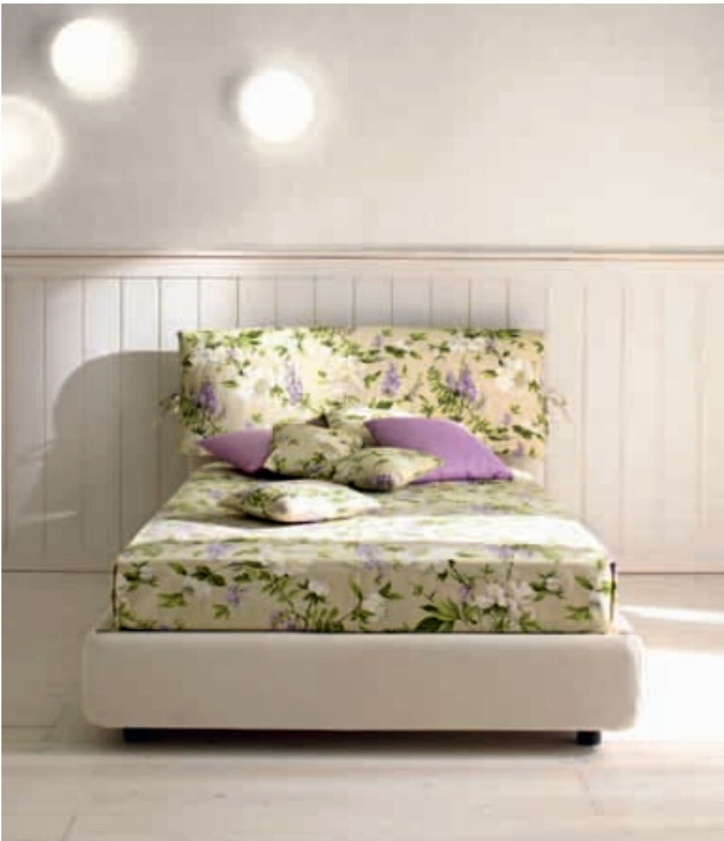
Letto 000 Letto 000