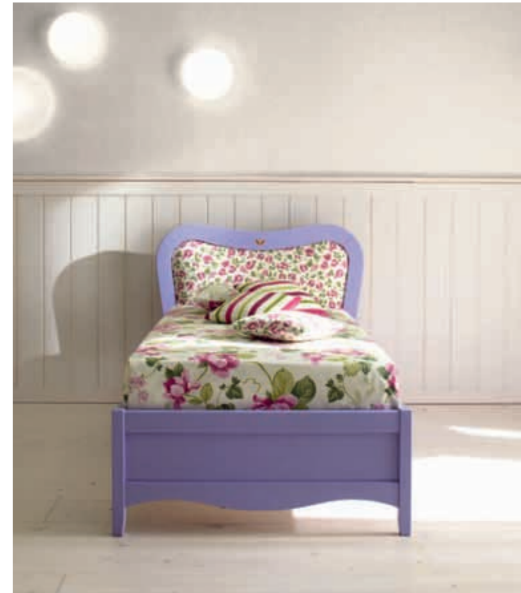
Letto 000 Letto 000